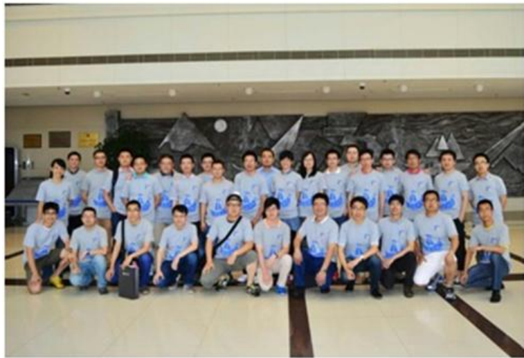
2005届船工系校友返校合影