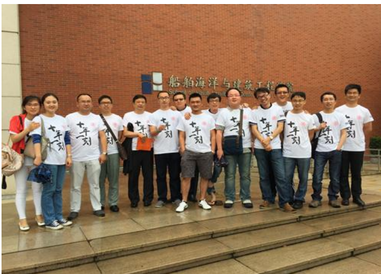
2005届土木系校友返校合影