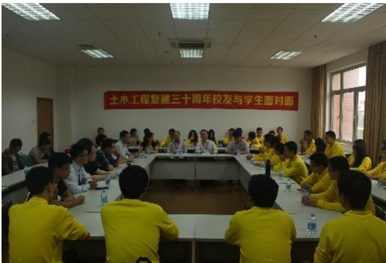
座谈会现场气氛热烈

10月24日,上海交通大学土木工程系恢复建系三十周年学科发展战略论坛在船建学院木兰船建大楼隆重举行,土木工程系历届校友代表也都回到了母校。下午2时许,在木兰船